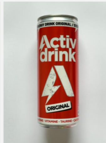
Impresión sobre sustrato transparente con fondo blanco