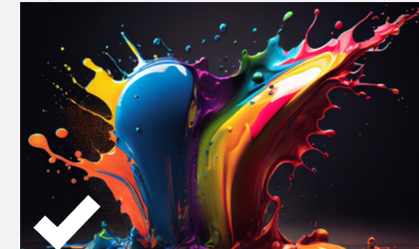
Resultado a 300 DPI después de la impresión

Requerimos un archivo con una resolución de 300 DPI.