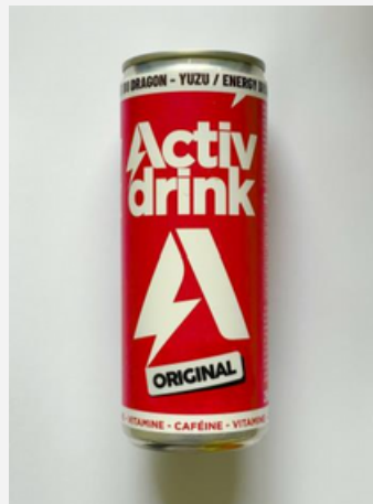
Impresión sobre sustrato blanco

Por favor, infórmenos si desea este efecto. Estaremos aquí para asesorarle.