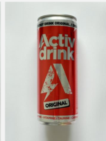
Impresión sobre sustrato transparente